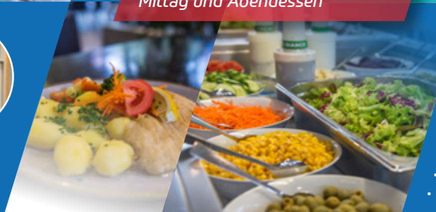
Auswahl aus Frühstück, Mittag und Abendessen