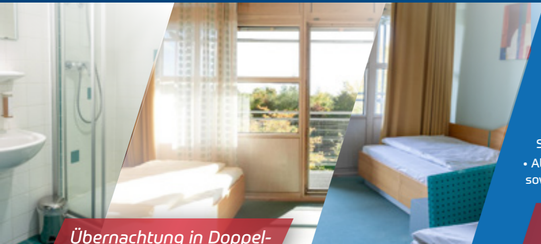
Übernachtung in Doppel- oder Dreibettzimmern